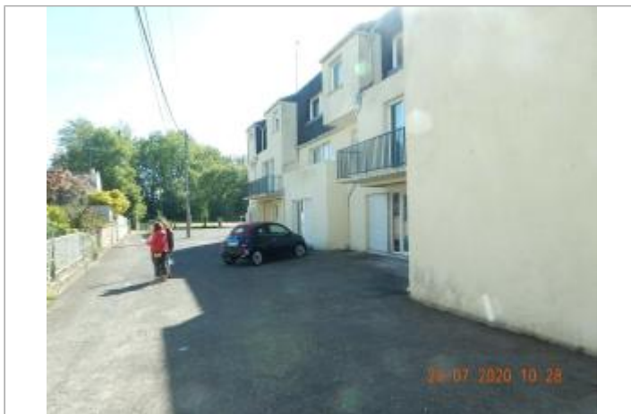
Impasse du croissant porte fenêtre