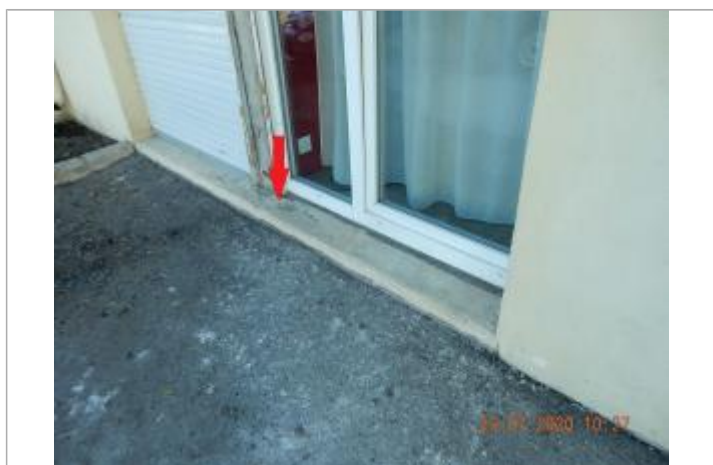
Laisse de crue sur margelle devant porte fenêtre

NIVELLEMENT SPC SACN. LE SPC N'EST PAS GÉOMÈTRE EXPERT, LES COTES SONT DONNÉES À TITRE INDICATIF.