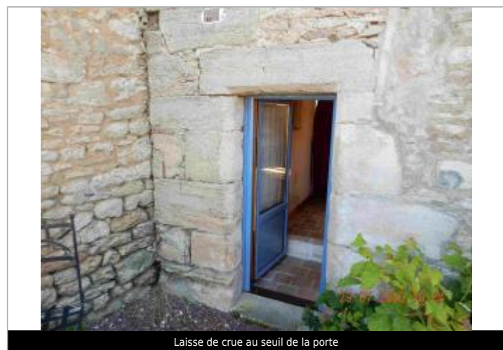
Laisse de crue au seuil de la porte

MARQUE Maximum de l'inondation : Oui Visibilité : Non État du repère : Disparu Pérennité : Aucune