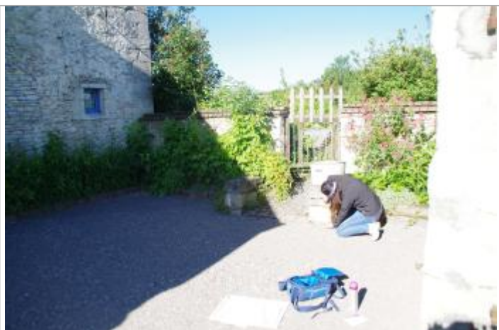
Laisse de crue sur muret de la cours

Altitude calculée de l'eau (en m) : 155.44