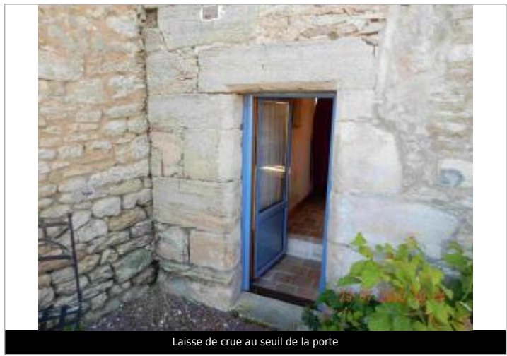
Laisse de crue au seuil de la porte

MARQUE Maximum de l'inondation : Oui Visibilité : Non État du repère : Disparu Pérennité : Aucune