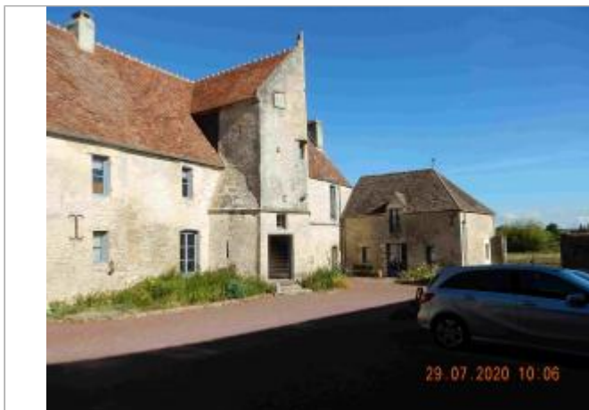
Manoir de Coulandon

Coordonnées WGS84 : X: -0.00623300 / Y: 48.73148500