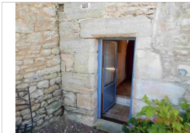
Laisse de crue au seuil de la porte

NIVELLEMENT SPC SACN. LE SPC N'EST PAS GÉOMÈTRE EXPERT, LES COTES SONT DONNÉES À TITRE INDICATIF. - 04/08/2020