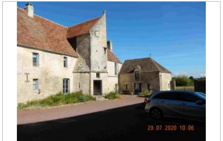
Manoir de Coulandon

Coordonnées WGS84 : X: -0.00623300 / Y: 48.73148500