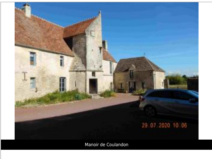
Manoir de Coulandon

GÉOLOCALISATION Coordonnées WGS84 : X: -0.00623300 / Y: 48.73148500 Coordonnées RGF93 (Lambert 93) X: 478945.21 / Y: 6852137.37 Coordonnées RGF93 (ETRS89) : X: -0.006233 / Y: 48.731485 Code Hydro: I2--0200 Rive de référence: Gauche