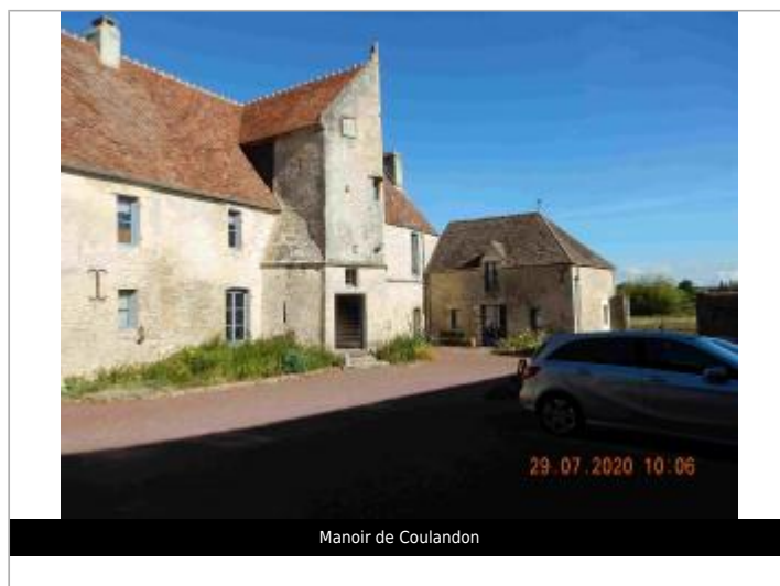
Manoir de Coulandon

GÉOLOCALISATION Coordonnées WGS84 : X: -0.00623300 / Y: 48.73148500 Coordonnées RGF93 (Lambert 93) X: 478945.21 / Y: 6852137.37 Coordonnées RGF93 (ETRS89) : X: -0.006233 / Y: 48.731485 Code Hydro: I2--0200 Rive de référence: Gauche