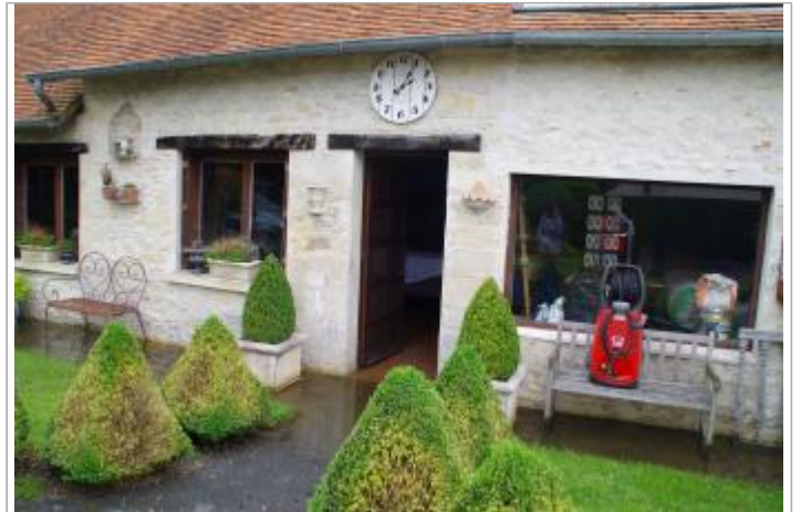
37 rue de Coulandon