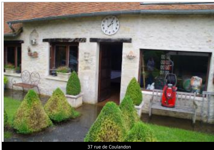
37 rue de Coulandon

GÉOLOCALISATION Coordonnées WGS84 : X: -0.00058950 / Y: 48.72717590 Coordonnées RGF93 (Lambert 93) X: 479341.79 / Y: 6851642.83 Coordonnées RGF93 (ETRS89) : X: -0.0005895 / Y: 48.7271759 Code Hydro: I2--0200 Rive de référence: Gauche