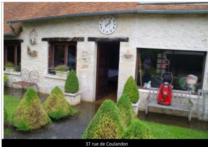
37 rue de Coulandon