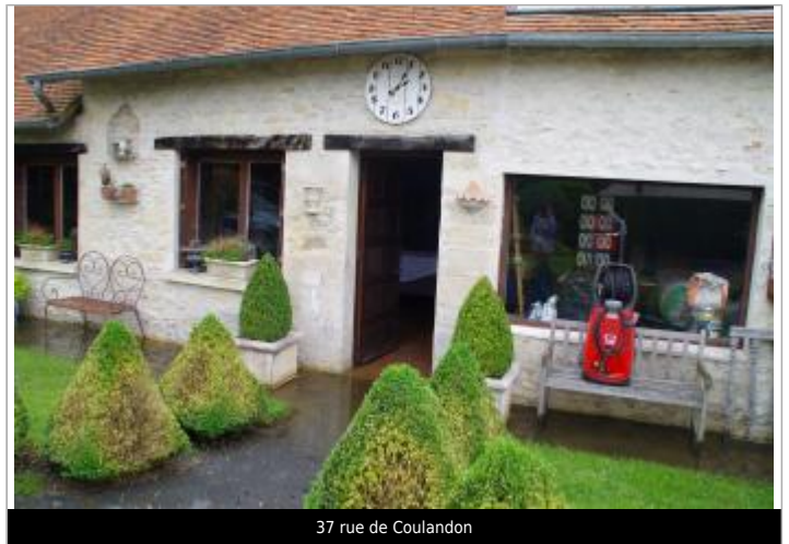
37 rue de Coulandon

GÉOLOCALISATION Coordonnées WGS84 : X: -0.00058950 / Y: 48.72717590 Coordonnées RGF93 (Lambert 93) X: 479341.79 / Y: 6851642.83 Coordonnées RGF93 (ETRS89) : X: -0.0005895 / Y: 48.7271759 Code Hydro: I2--0200 Rive de référence: Gauche