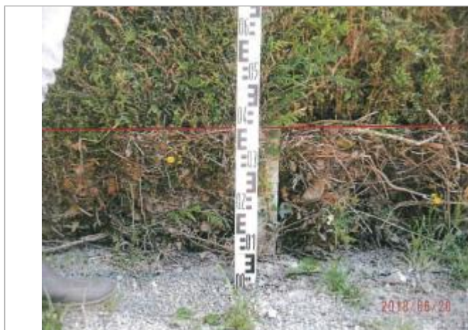
Repère du site de la voirie d'Essay

Altitude calculée de l'eau (en m) : 152.37 m