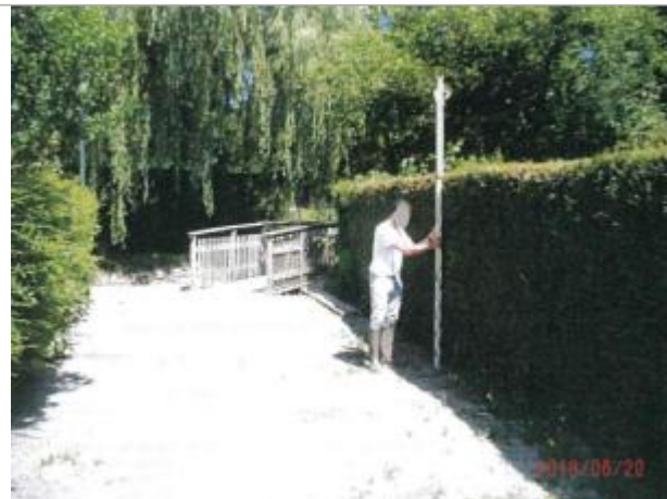
Vue du site de la voirie d'Essay

Coordonnées WGS84 : X: 0.24502807 / Y: 48.54287300