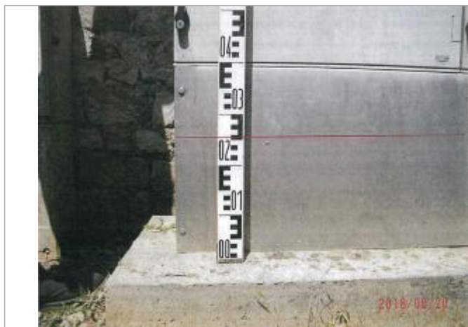
Repère du hameau "Le Perron"

Altitude calculée de l'eau (en m) : 162.06