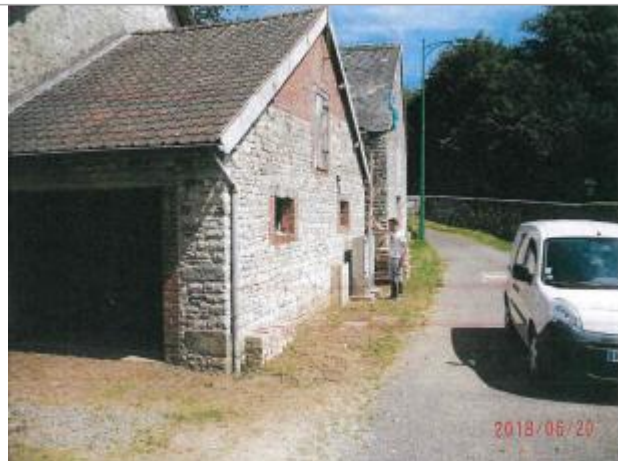
Site du hameau "Le Perron"