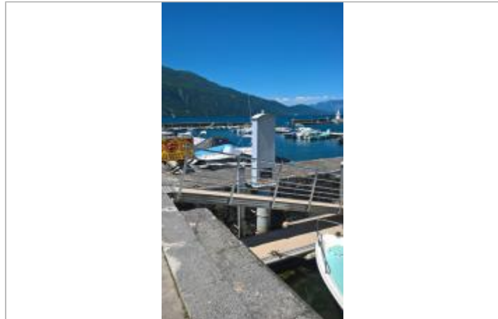
Repère de crue 1990 et 1944 au grand port