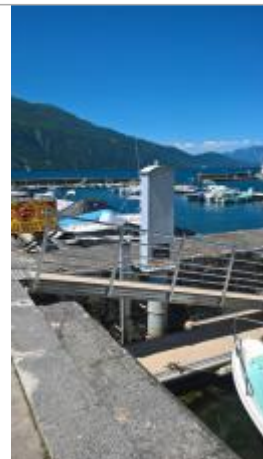
Repère de crue 1990 et 1944 au grand port