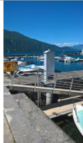
Repère de crue 1990 et 1944 au grand port