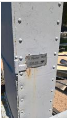
Crue de février 1990, sur le limnigraphe