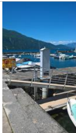
Repère de crue 1990 et 1944 au grand port