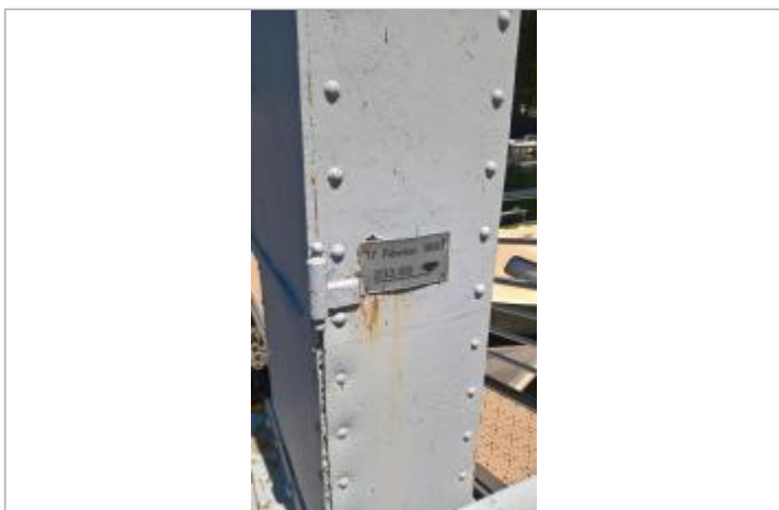
Crue de février 1990, sur le limnigraphe

Texte : 17 février 1990, 233.69 Maximum de l'inondation : Non renseigné