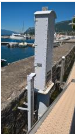
limnigraphe et les deux repères