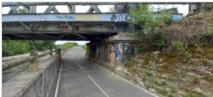
Pont sncf en bordure de piste cyclable, rive gauche de la Leysse