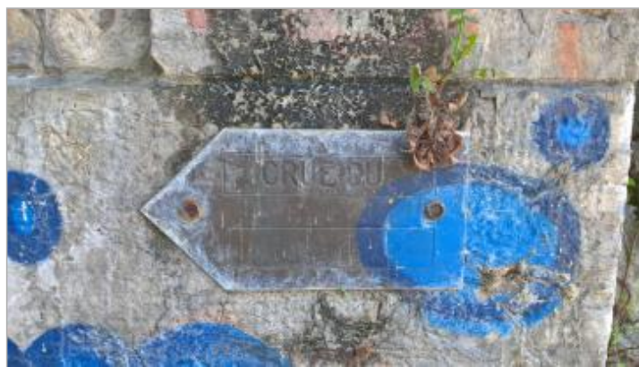
repère de crue 15 février 1990