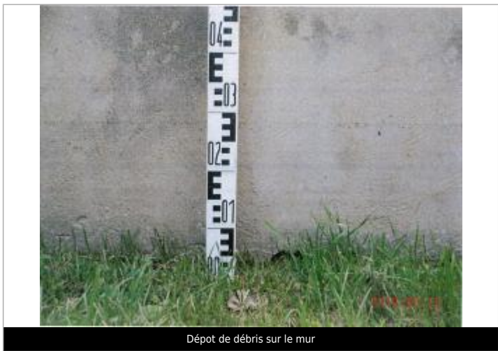
Dépôt de débris sur le mur

MARQUE Texte : Dépôts de débris sur le mur Maximum de l'inondation : Oui Visibilité : Oui État du repère : Bon Pérennité : Aucune