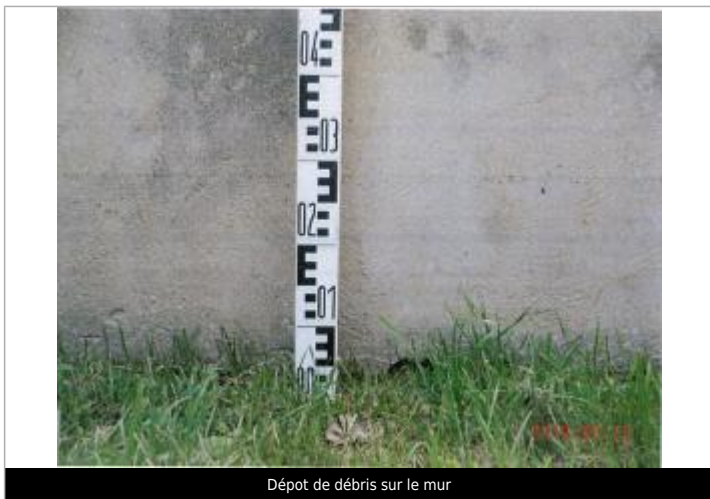
Dépôt de débris sur le mur

Texte : Dépôts de débris sur le mur Maximum de l'inondation : Oui Visibilité : Oui État du repère : Bon Pérennité : Aucune