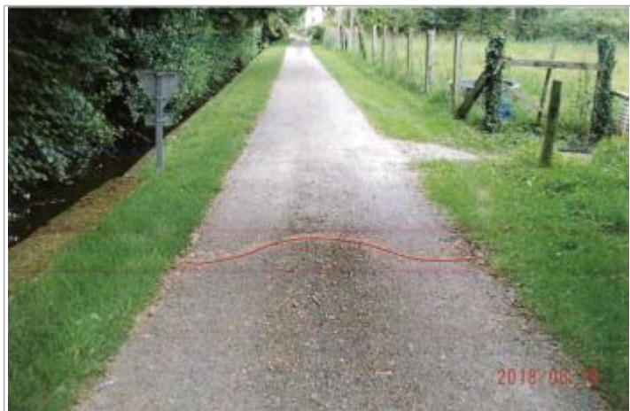
Laisse de débris sur la route

Texte : Laisse de débris sur la route Maximum de l'inondation : Oui Visibilité : Oui État du repère : Bon Pérennité : Aucune