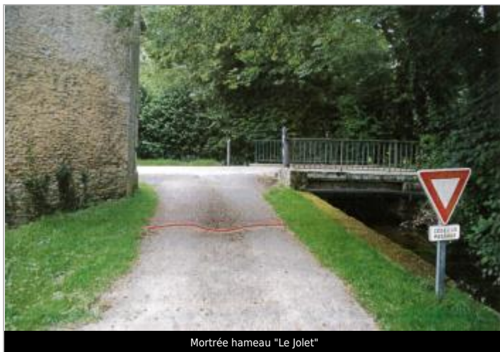
Mortrée hameau "Le Jolet"