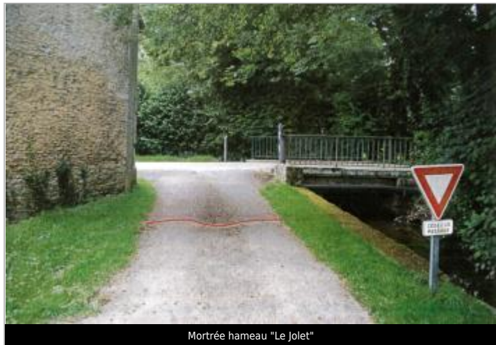
Mortrée hameau "Le Jolet"