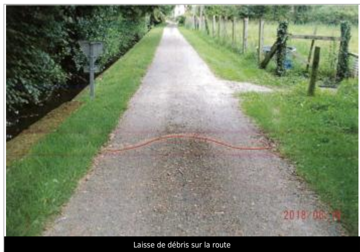
Laisse de débris sur la route