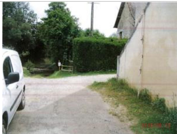
Mortrée hameau "La petite Mortrée"