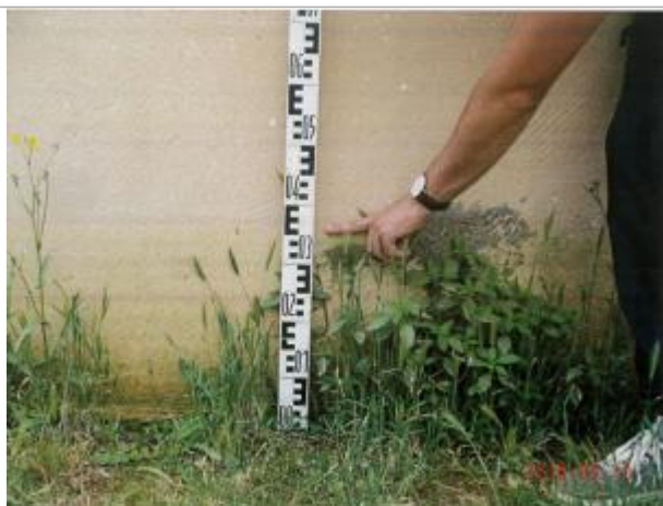
Laisse de crue sur le bas du mur d'une habitation