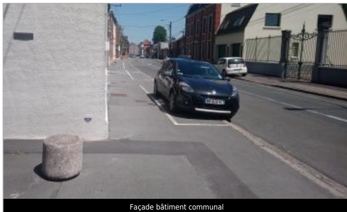
Façade bâtiment communal