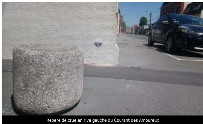
Repère de crue en rive gauche du Courant des Amoureux