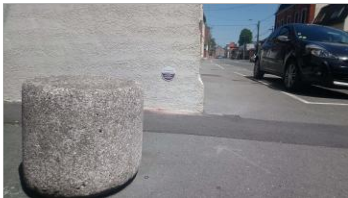
Repère de crue en rive gauche du Courant des Amoureux