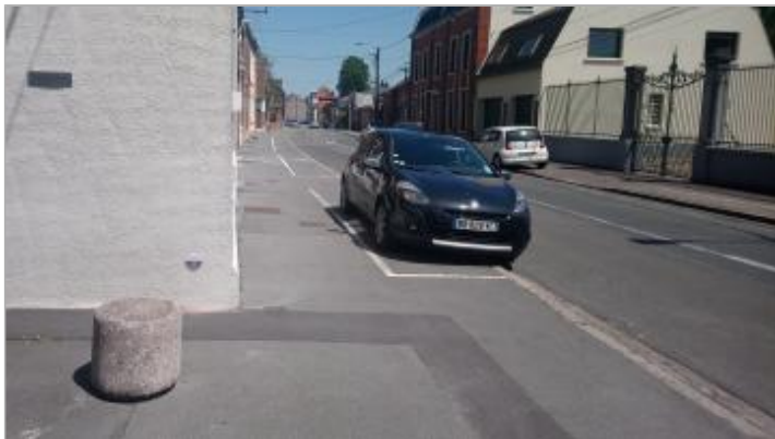
Repère de crue en rive gauche du Courant des Amoureux