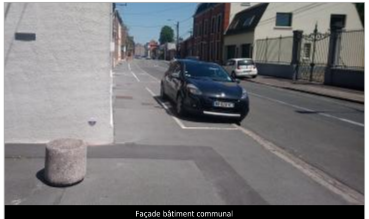
Façade bâtiment communal