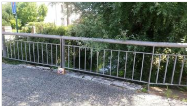
Repère de crue en rive gauche de la Blanche