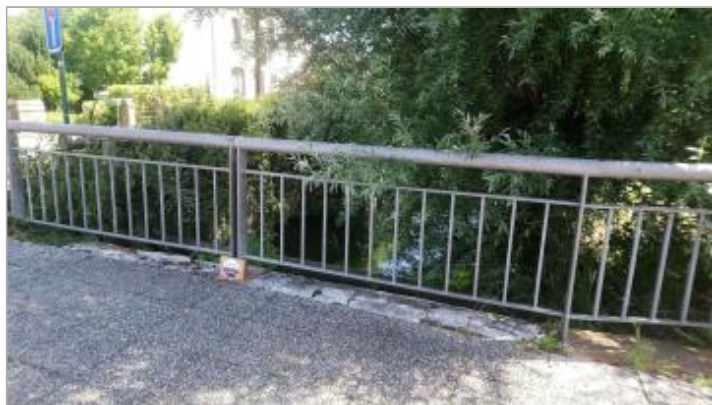
Repère de crue en rive gauche de la Blanche