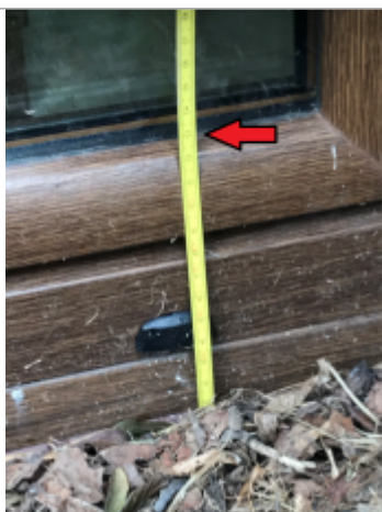
Laisse de crue 13 cm/sol au niveau de la fenêtre côté Seine

Altitude calculée de l'eau (en m) : 5.242