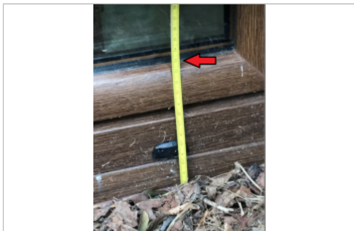
Laisse de crue 13 cm/sol au niveau de la fenêtre côté Seine