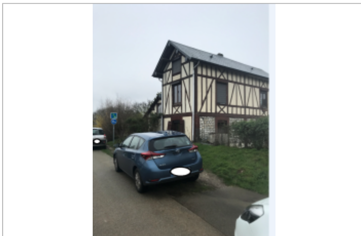
Val de la Haye, 1 chemin des templiers

Coordonnées WGS84 : X: 0.99853595 / Y: 49.37098400