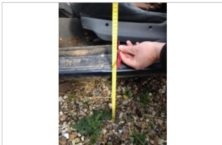
Laisse de crue au niveau du bas de la portière (33cm du sol)

NIVELLEMENT SPC SACN. LE SPC N'EST PAS GÉOMÈTRE EXPERT, LES COTES SONT DONNÉES À TITRES INDICATIF. - 30/09/2021