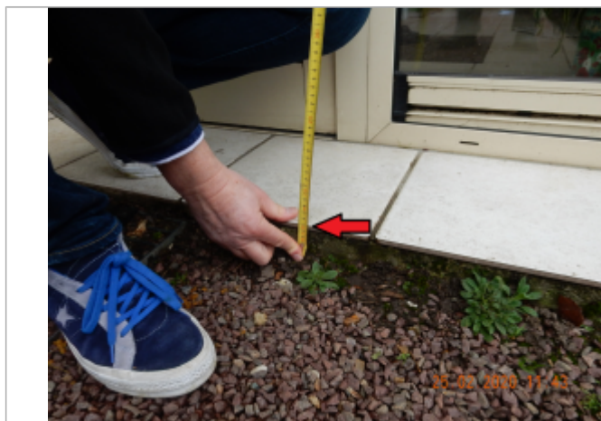
Laisse de crue au niveau de la margelle devant la véranda

NIVELLEMENT SPC SACN. LE SPC N'EST PAS GÉOMÈTRE EXPERT, LES COTES SONT DONNÉES À TITRES INDICATIF. - 05/03/2021