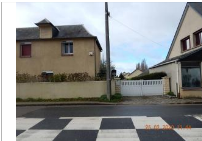
Berville sur Seine 40 route du bac