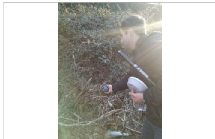
Vue de la laïsse - Auteur : DDTM2A