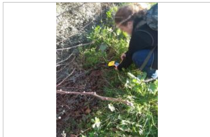
Vue de la laïsse