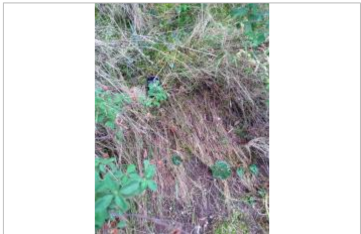
Vue de la laïsse

GÉNÉRAL Code : DDTM2A-19_R_G5-H_1 Date de mise à jour : 19/06/2020 Auteur : DDTM2A