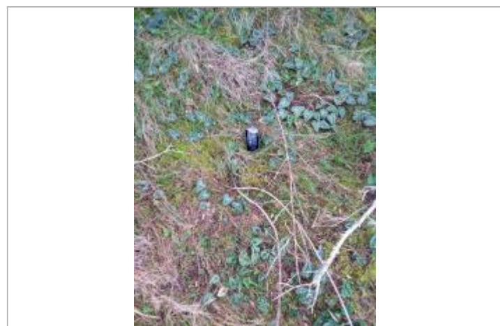
Vue de la laïsse - Auteur : DDTM2A

GÉNÉRAL Code : DDTM2A-19_R_G5-G_1 Date de mise à jour : 23/06/2020 Auteur : DDTM2A