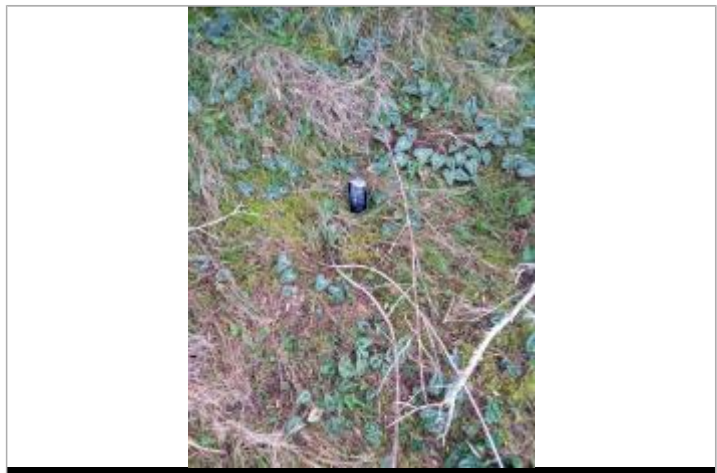
Vue de la laïsse - Auteur : DDTM2A

GÉNÉRAL Code : DDTM2A-19_R_G5-G_1 Date de mise à jour : 23/06/2020 Auteur : DDTM2A