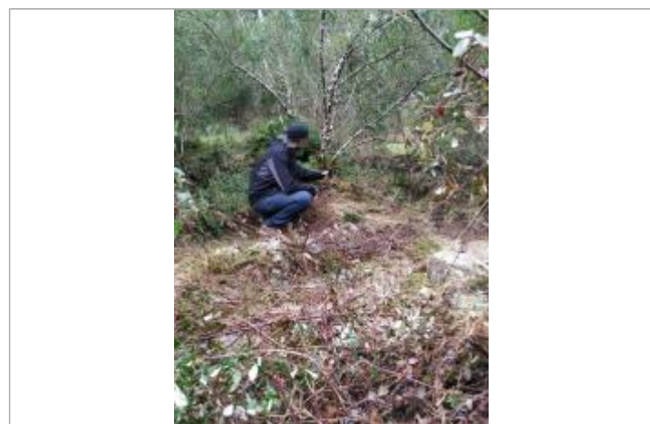
Vue de la laisse - Auteur : DDTM2A