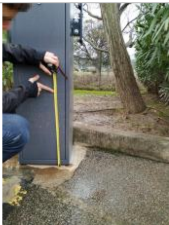
Vue de la laisse - Auteur : DDTM2A