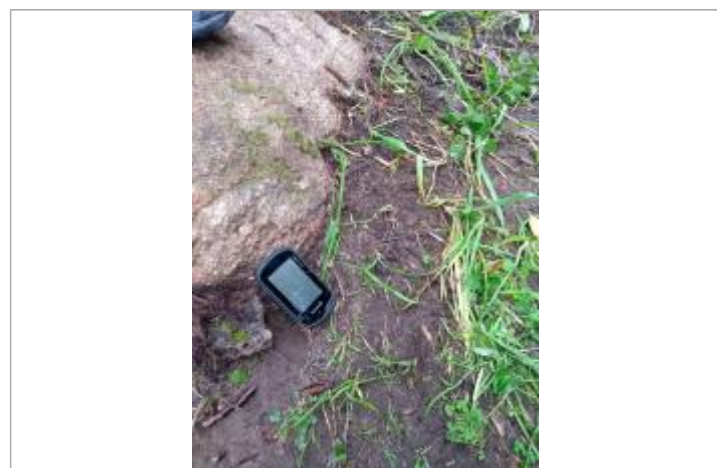
Vue de la laïsse

GÉNÉRAL Code : DDTM2A-19_R_G1-A_1 Date de mise à jour : 23/06/2020 Auteur : DDTM2A