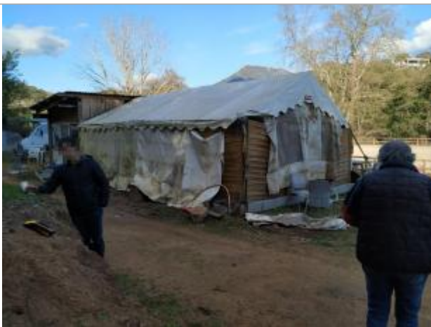
Vue de la laisse - Auteur : DDTM2A