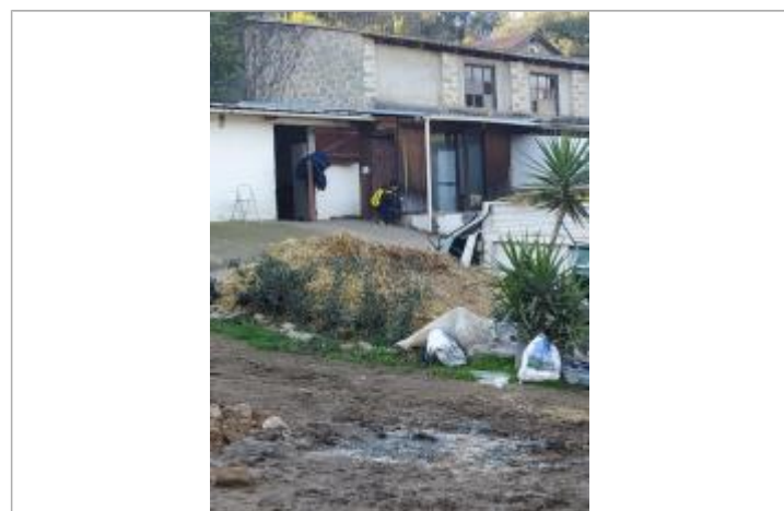
Vue de la laïsse

GÉNÉRAL Code : DDTM2A-19_R_P3-B_1 Date de mise à jour : 19/06/2020 Auteur : DDTM2A