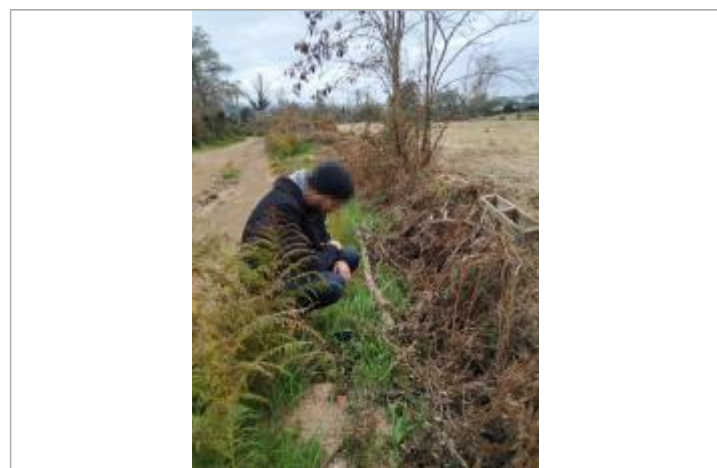
Vue de la laïsse - Auteur : DDTM2A

GÉNÉRAL Code : DDTM2A-19_R_G6-B_1 Date de mise à jour : 21/06/2020 Auteur : DDTM2A