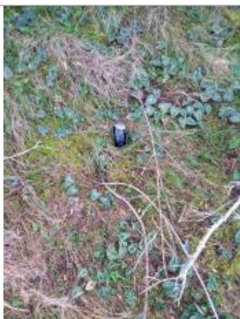
Vue de la laïsse

Différence entre le niveau d'eau et la référence (en m) : 0.000 m