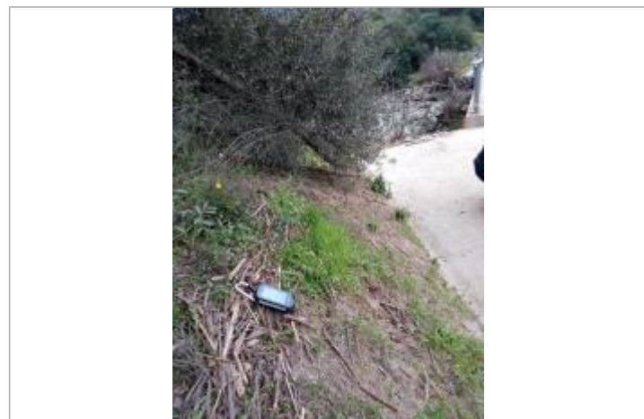
Vue de la laïsse