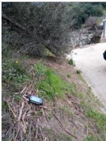
Vue de la laïsse

Différence entre le niveau d'eau et la référence (en m) : 0.000 m