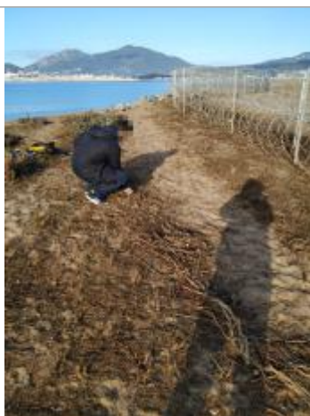
Vue de la laisse - Auteur : DDTM2A