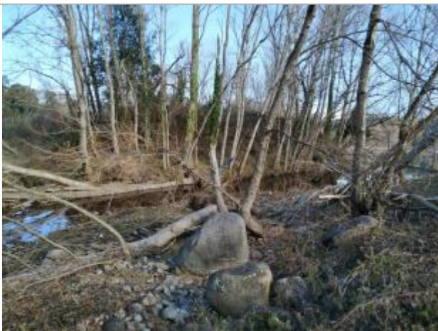
Vue de la laisse - Auteur : DDTM2A