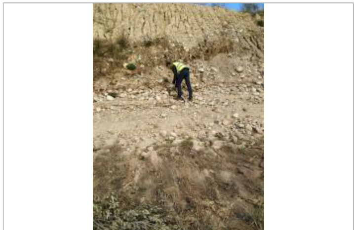
Vue de la laïsse - Auteur : DDTM2A

GÉNÉRAL Code : DDTM2A-19_R_G11-B_1 Date de mise à jour : 20/06/2020 Auteur : DDTM2A