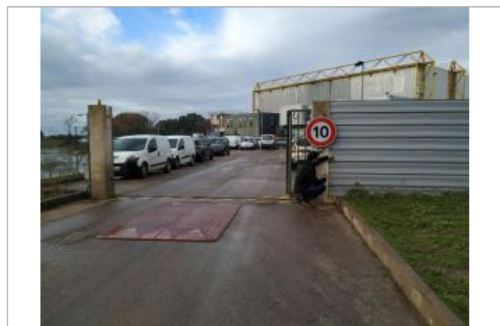
Vue de la laisse - Auteur : DDTM2A