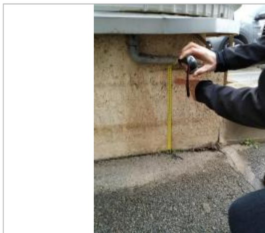
Vue de la laisse - Auteur : DDTM2A