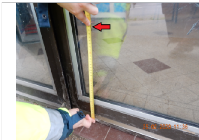
Laisse de crue sur baie vitrée du bar tabac

Maximum de l'inondation : Oui Visibilité : Oui État du repère : Mauvais Pérennité : Aucune