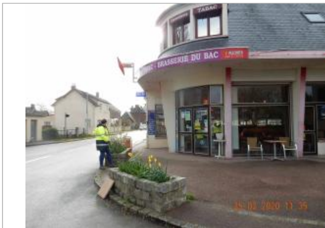
Bar tabac Berville sur Seine