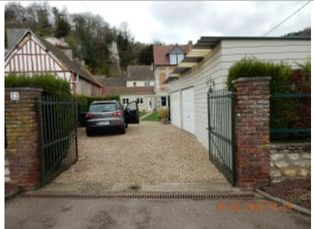
Cours du pavillon au 23 Quai des Roches

Coordonnées WGS84 : X: 1.00980090 / Y: 49.40351600