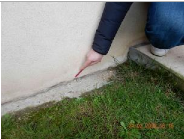
L'eau a atteint le bas du mur du pavillon

Altitude calculée de l'eau (en m) : 5.32 m