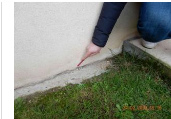
L'eau a atteint le bas du mur du pavillon

NIVELLEMENT SPC SACN. LE SPC N'EST PAS GÉOMÈTRE EXPERT, LES COTES SONT DONNÉES À TITRES INDICATIF. - 01/10/2021