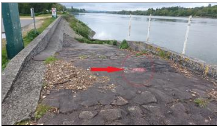
Vue depuis la berge à l'aval