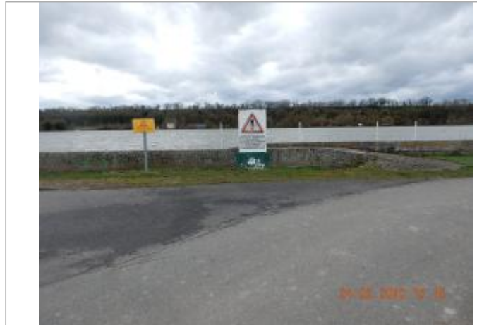
Muret de protection, Le Marais Chaussée Saint Georges

Coordonnées WGS84 : X: 0.93858354 / Y: 49.44976500