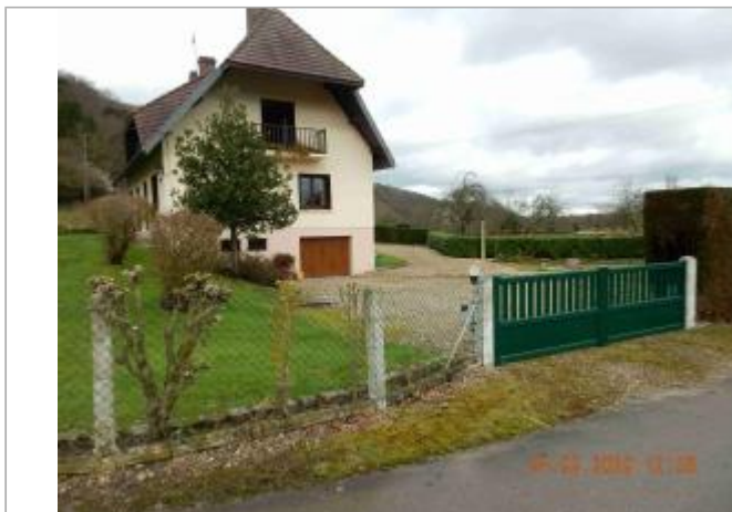
Bardouville 7 chemin du Roy

Coordonnées WGS84 : X: 0.92199433 / Y: 49.41470200