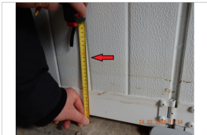
Laisse de crue sur porte du garage à 19 cm du sol