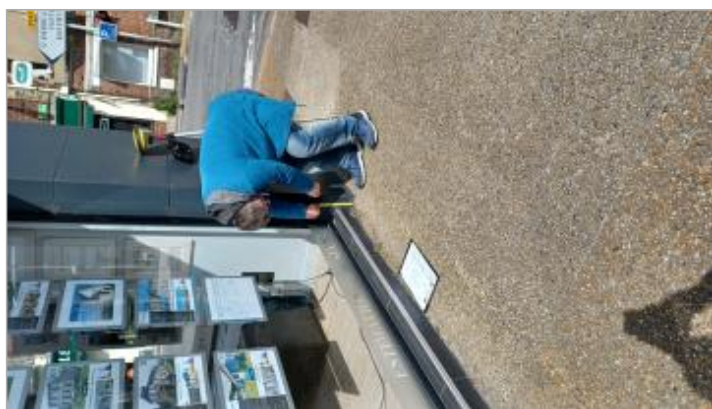
Vue depuis le Quai de la Libération