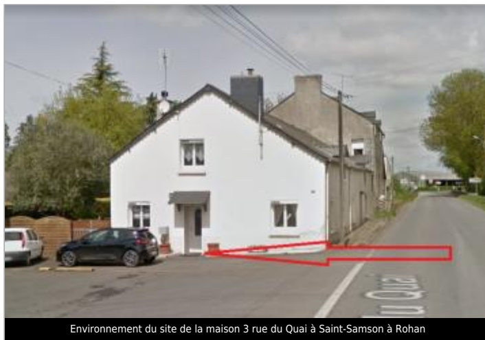
Environnement du site de la maison 3 rue du Quai à Saint-Samson à Rohan