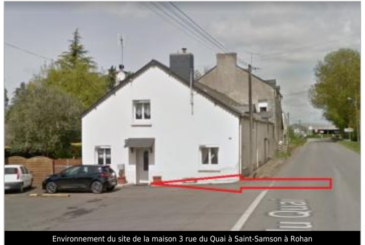
Environnement du site de la maison 3 rue du Quai à Saint-Samson à Rohan

Coordonnées WGS84 : X: -2.76916900 / Y: 48.08803900