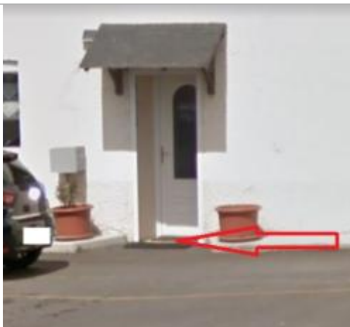
Seuil de la porte d'entrée de la maison

Altitude calculée de l'eau (en m) : 66.67