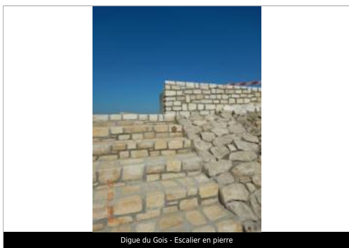
Digue du Gois - Escalier en pierre

Texte : Xynthia 2010 Maximum de l'inondation : Oui Visibilité : Oui