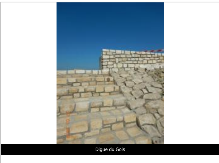
Digue du Gois