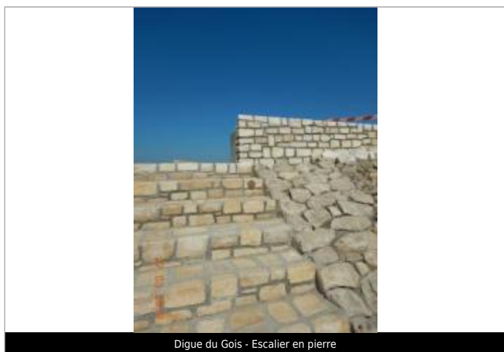
Digue du Gois - Escalier en pierre

Texte : Xynthia 2010 Maximum de l'inondation : Oui Visibilité : Oui