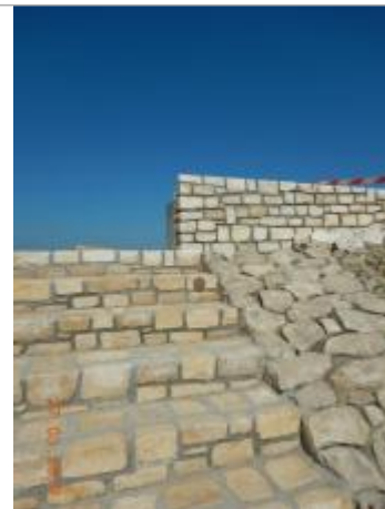
Digue du Gois

Coordonnées RGF93 (ETRS89) : X: -2.1481112 / Y: 46.933814