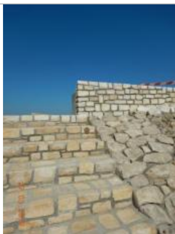
Digue du Gois - Escalier en pierre