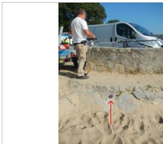
Sableaux Sud - Perré en pierre