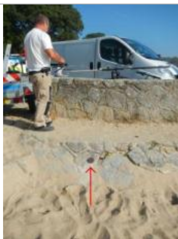
Sableaux Sud - Perré en pierre