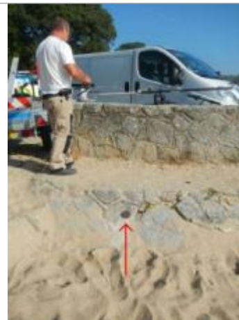
Sableaux Sud - Perré en pierre

Coordonnées RGF93 (ETRS89) : X: -2.2206444 / Y: 47.0030878