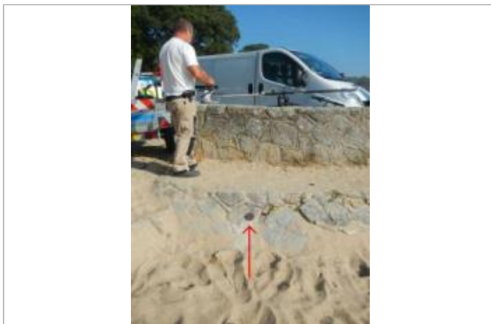
Sableaux Sud - Perré en pierre