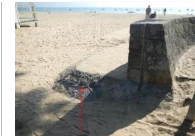
Sableaux Nord - Perré en pierre