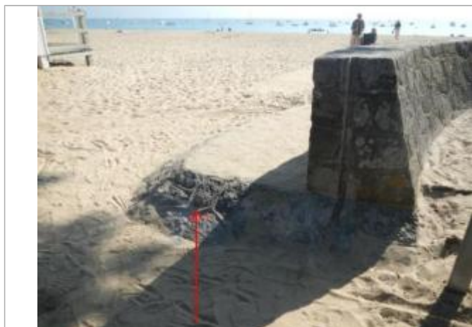
Sableaux Nord - Perré en pierre