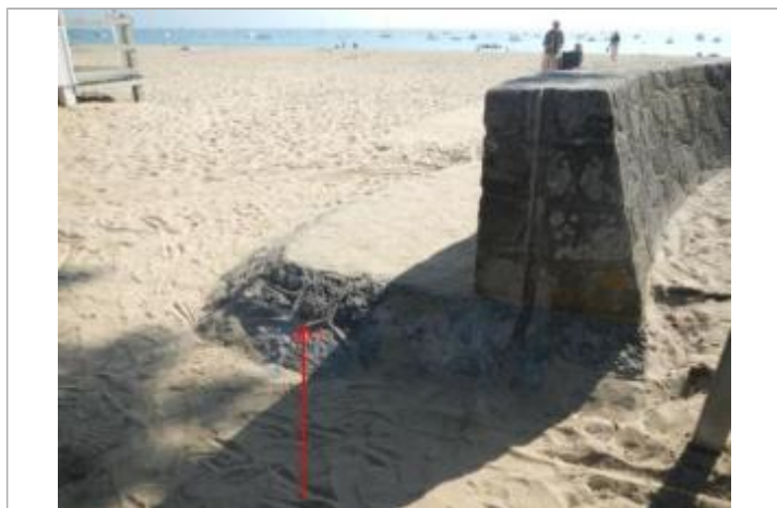
Sableaux Nord - Perré en pierre

Texte : Xynthia 2010 Maximum de l'inondation : Oui Visibilité : Oui