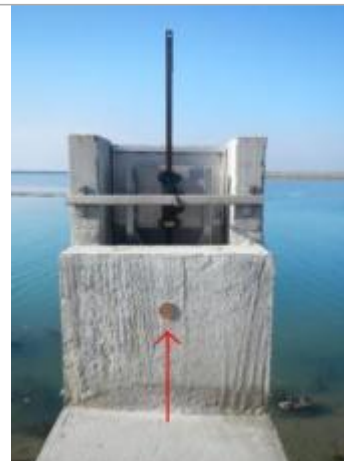
Jetée Jacobsen - Ouvrage hydraulique

Coordonnées RGF93 (ETRS89) : X: -2.2316611 / Y: 46.9948932