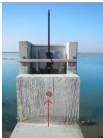
Jetée Jacobsen - Ouvrage hydraulique