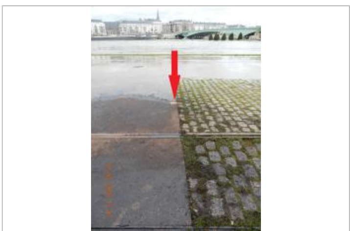
Marque de peinture au sol sur le quai à l'Ouest du pont Corneille près des rails

MARQUE Maximum de l'inondation : Oui Visibilité : Oui État du repère : Bon Pérennité : Moyenne