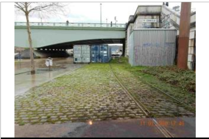
Quai de Seine à l'Ouest du pont Corneille

GÉOLOCALISATION Coordonnées WGS84 : X: 1.09352580 / Y: 49.43534300 Coordonnées RGF93 (Lambert 93) X: 561682.48 / Y: 6927881.4 Coordonnées RGF93 (ETRS89) : X: 1.0935258 / Y: 49.435343 Code Hydro: ----0010 Rive de référence: Gauche