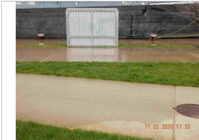
Quai de Seine à l'Est du pont Guillaume le Conquérant (à 400 m)

Coordonnées WGS84 : X: 1.08452620 / Y: 49.43826700