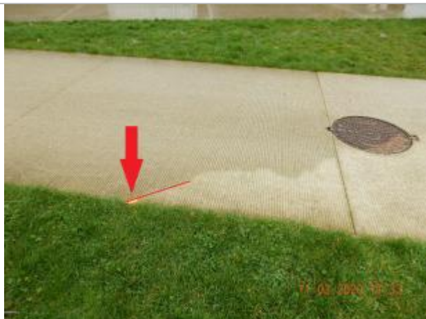
Marque de peinture au sol sur le quai à l'Est du pont Guillaume le Conquérant (400 m)

NIVELLEMENT SPC SACN. LE SPC N'EST PAS GÉOMÈTRE EXPERT, LES COTES SONT DONNÉES À TITRE INDICATIF. - 05/08/2020